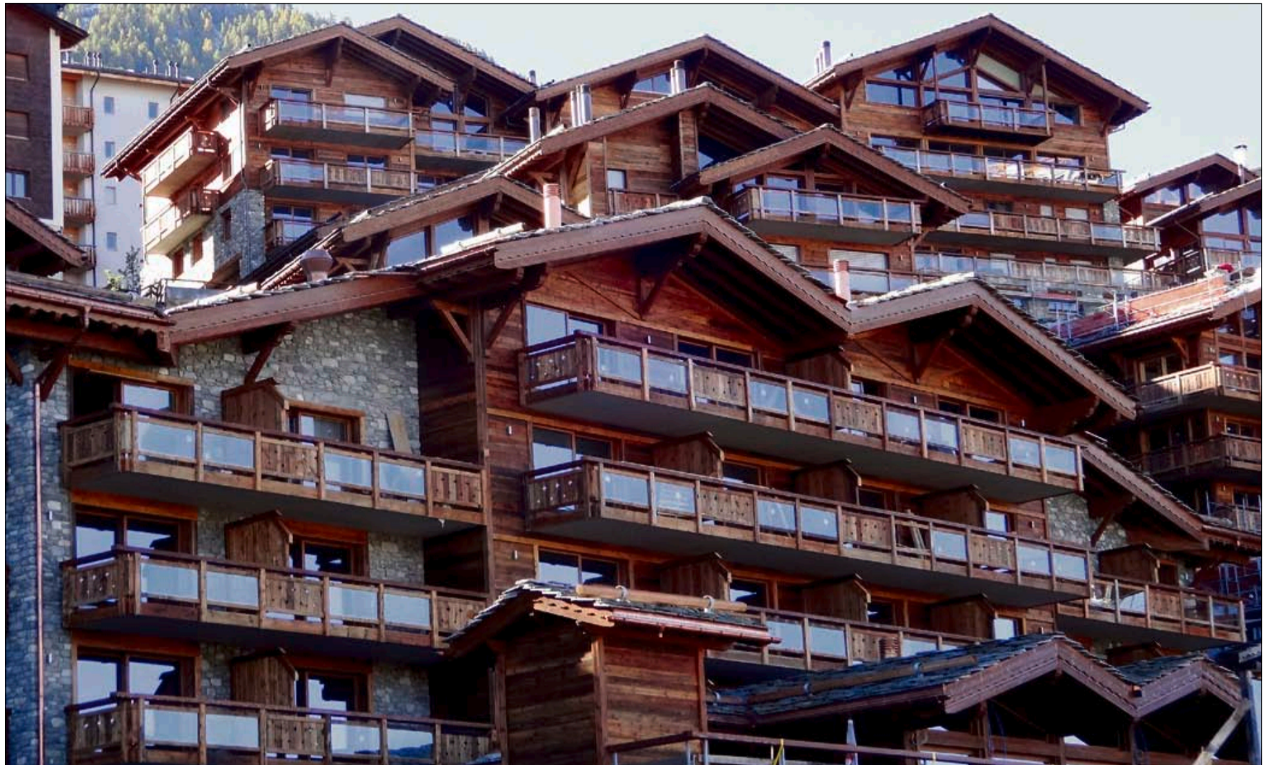
Le complexe Mer de Glace de Nendaz devrait être intégralement terminé le 7 décembre.